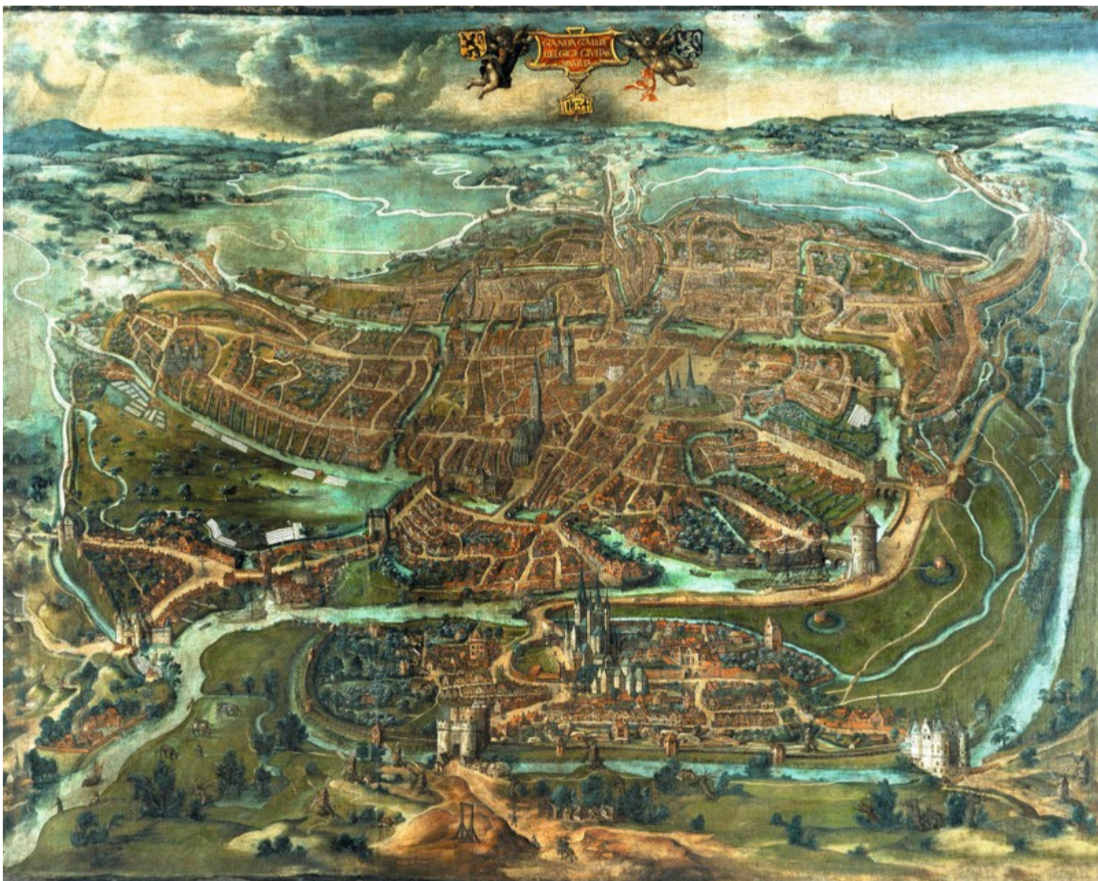
Zicht op Gent.

In dit vervolg trekt Van Loo tijdens verschillende tijdreizen op speurtocht naar de zicht- en tastbare restanten van de Bourgondische hertogen. Daarbij beperkt hij zich absoluut niet tot de usual suspects Gent of Brugge. Van Dinant tot Dadizele, van Bern tot Breda, werkelijk overal hebben de Bourgondiërs sporen nagelaten. Van Loo illustreert overtuigend hoe hun verhaal meer is dan een interludium in de Franse geschiedschrijving en de eenwording van de Lage Landen. Hun verhaal is Europese geschiedenis van formaat.